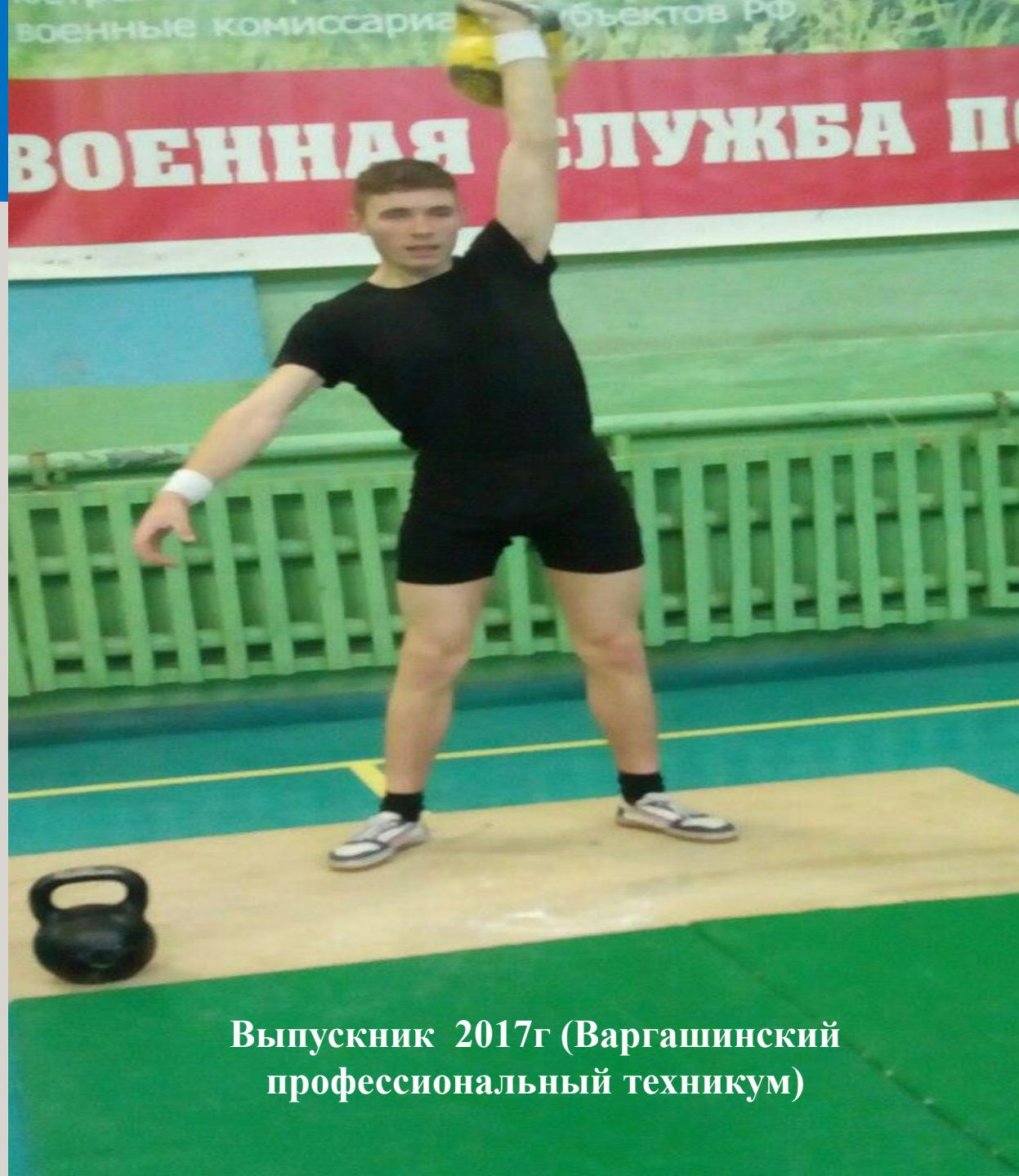
Выпускник 2017г (Варгашинский профессиональный техникум)