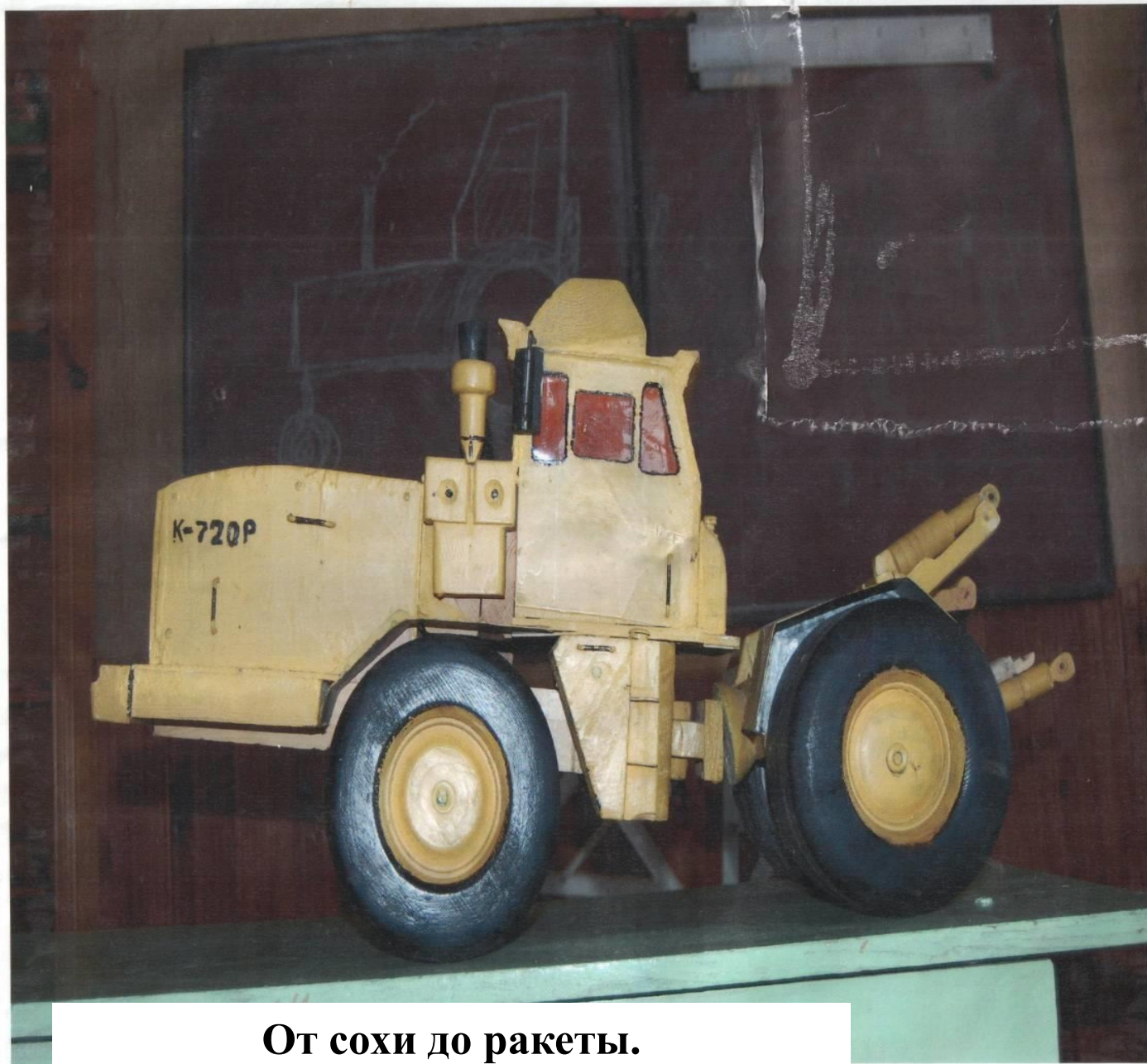
От сохи до ракеты.